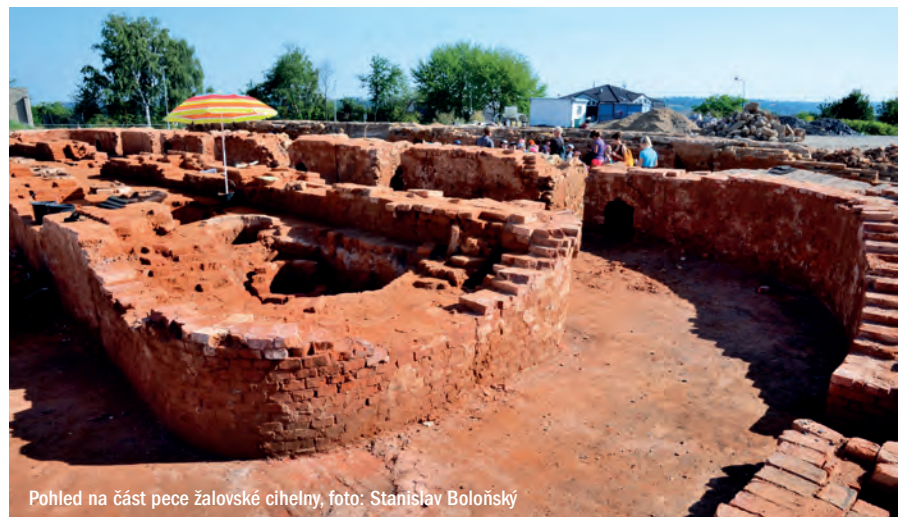
Pohled na část pece žalovské cihelny, foto: Stanislav Boloňský

Komu? Nadaci rodiny Vlčkových, známých filantropů, kteří opravují historickou usedlost Cibulka. Vznikne v ní hospic pro