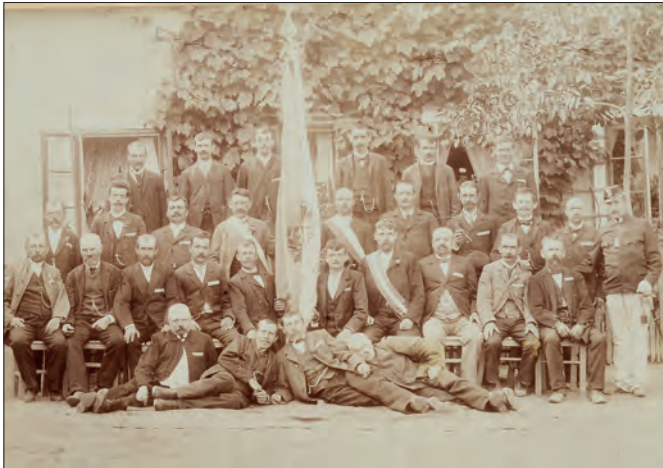
Společná fotografie členů spolku Průmyslová beseda v Roztokách, založeného v roce 1871, foto: archiv Středočeského muzea