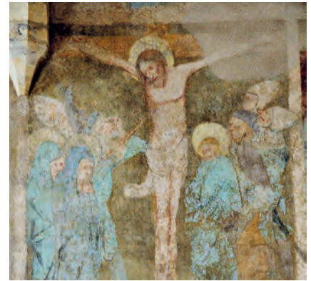
Scéna Ukřižování z pašiového cyklu nástěnných maleb v kostele sv. Klimenta na Levém Hradci.