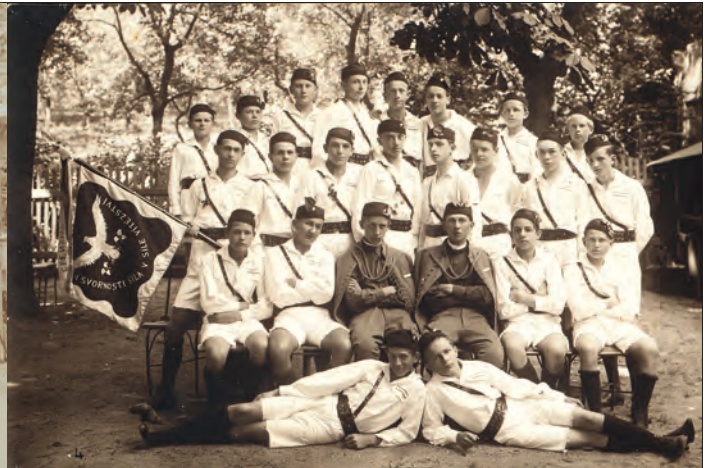
Dorostenci Sokola v Roztokách ve slavnostních krojích s novým praporem, 1932, foto: archiv Středočeského muzea