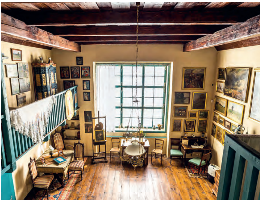
Ateliér malířky Zdenky Braunerové

S nadcházejícím jarem naplno ožívá nejen příroda, ale i muzeum. Připravujeme program plný nevšedních kulturních zážitků – od nových výstavních projektů přes koncerty a divadla až po kreativní workshopy.