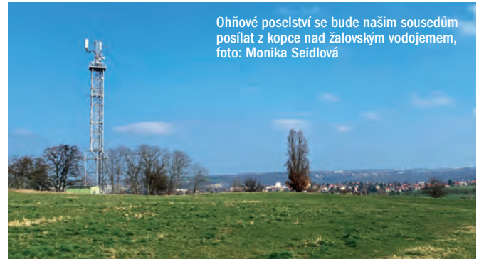
Ohňové poselství se bude našim sousedům posílat z kopce nad žalovským vododojemem

Je to posílání ohňových či kouřových signálů z kopce na kopec. Už od pradávna lidstvo vyvinulo mnoho způsobů komunikace na dálku a jedním z nejzajímavějších spojení mezi starověkými a moderními praktikami je koncept známý jako „Keltský telegraf“. Přestože se zdá být pojmenováním odvozený od keltské kultury, propojení mezi ním a samotnými Kelty je zahaleno do závoje tajemství a spekulací. Keltové, starověký kmen, byli známí svou pokročilou kulturou a technologiemi, které překonávaly svou dobu. Zatímco nedostatek písemných záznamů o jejich