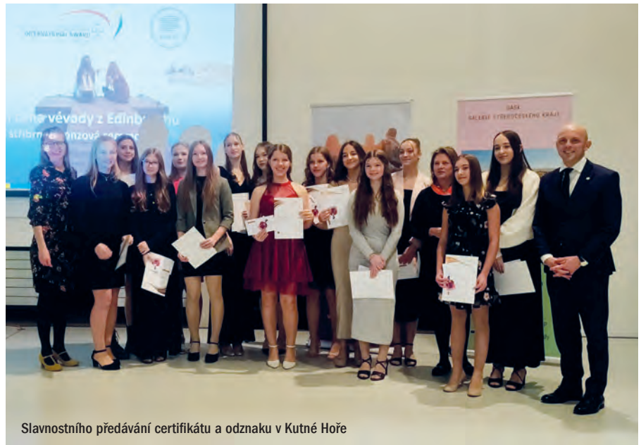
Slavnostního předávání certifikátu a odznaku v Kutné Hoře