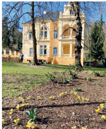
Krokusy vysazené do tvaru Davidovy hvězdy

Na tělocvik chodí přes zimu všechny třídy do sokolovny. Letos jsou obvyklé hodiny střídány projektovými lekci Svět z papíru. Jedná se o soubor kre-