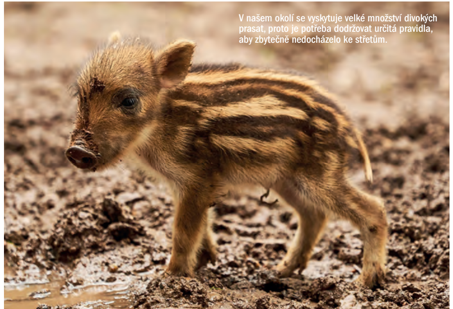
V našem okolí se vyskytuje velké množství divokých prasat, proto je potřeba dodržovat určitá pravidla, aby zbytečně nedocházelo ke střetům.

A jak je to vlastně s tou velmi diskutovanou otázkou o volném pohybu psů a koček v přírodě? Zákon o myslivosti č. 449/2001 Sb., zakazuje vlastníkům domácích zvířat nechat je volně pobíhat mimo vliv svého majitele nebo vedoucího. Není tedy nezbytné mít psa stále na vodítku, ale to pouze za předpokladu, že je pes vycvičen a svého majitele na 100 % poslouchá, a to hlavně při přivolání a odvolání od situace, kdy například narazí na zvěř tak, aby ji nepronásledoval a nehonil. Mnohokrát jsme se již setkali s pejskaři, kteří vůbec nerespektují fakt, že v přírodě v našem okolí se zvěř nachází, psy nechávají volně zabíhat do remízků, zarostlých rumišť, vysokých trav, přičemž tato jsou právě ta místa, kde má zvěř svá útočiště, kde jsou na zemi hnízdící ptáci, kterým se při častějším opu-