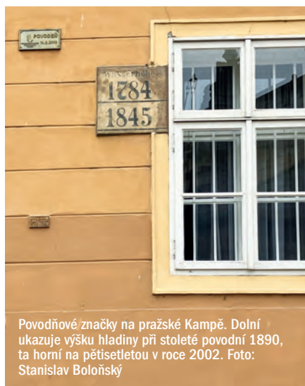
Povodňové značky na pražské Kampě. Dolní ukazuje výšku hladiny při stoleté povodni 1890, ta horní na pětisetletou v roce 2002.

Na pozadí této nepříznivé klimatické situace dochází v květnu roku 1783 k obrovské erupci jedné z islandských sopek. Sopečný dým a prach byl hnán větrem nad evropskou pevninu a způsobil výrazné snížení intenzity slunečního záře-