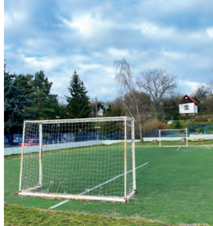
Venkovní hřiště v Opletalově ulici u žalovské školy projde rekonstrukcí

Radní vyhlásili výběrové řízení na rekonstrukci obecního bytu v Nádražní ulici. Rozhodnutím rady se byt po zemřelém nájemníci při rekonstrukci rozdělí na dva menší a minimálně jeden z nich bude určen pro sociální potřeby či pro zaměstnance obce. Předpokládá se hodnota rekonstrukce (po více než třicetiletém užívání) činí 1 690 000 Kč. Rada dále vyhlásila zadávací podmín-