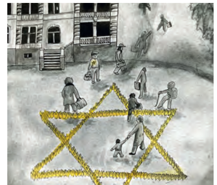
Ilustrace: Selma Al Jazairi